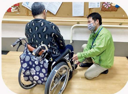
実際に器具を使用しながら、操作方法の説明を行います。また、それぞれの身体に合わせた調整をおこないます。