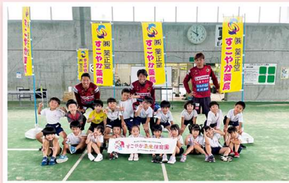
選手たちと仲良く記念撮影！