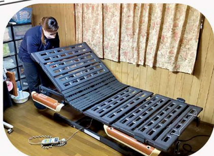
電動ベッド、車イス、エアマット、歩行器などのレンタルを行っています。