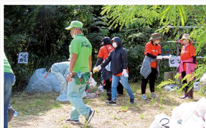
すこやかグループの社員やその家族、総勢39人が参加！