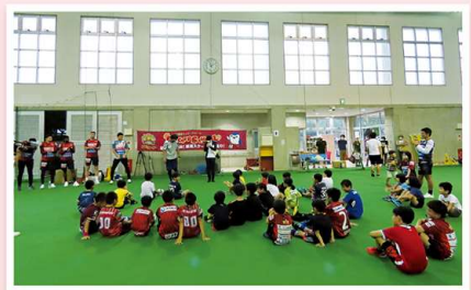
すこやかサッカー教室の開催は初めての取組みです！