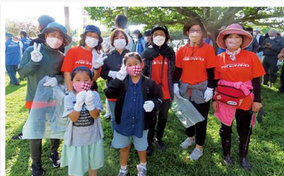
こどもたちも一緒に海岸を清掃♪