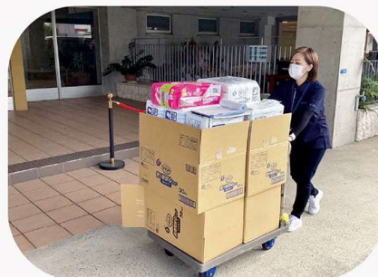
オムツなどのケア商品は、一般宅の他、介護施設や病院にもお届けします。