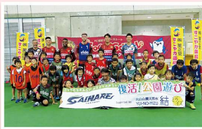
36名の子ども達が参加しました！