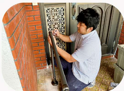
利用者さまのご自宅の環境を確認後、図面作成、設置工事を行います。

これまでの実績として、手摺設置、段差解消、ドアや滑り予防のための床材の変更、和式から洋式便器への転換、トイレの嵩上げをし段差をフラットにする工事などがあります。